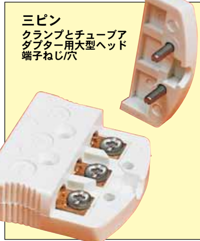
三ピン クランプとチューブアダプター用大型ヘッド端子ねじ穴