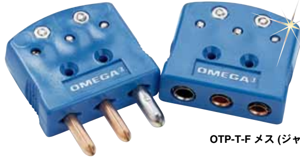
OTP-T-F メス (ジャック)