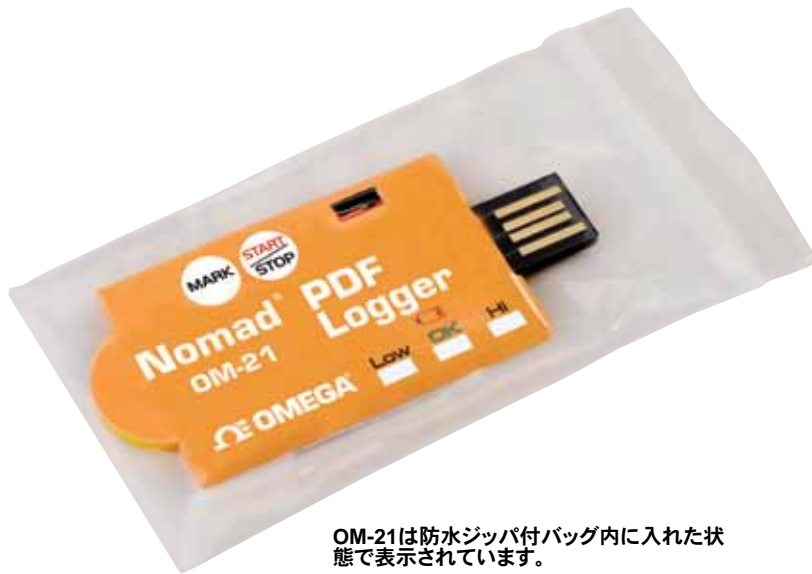
OM-21は防水ジップ付バッグ内に入れた状態で表示されています。

動作湿度: 相対湿度80%未満 保管温度: -40~85°C 保管湿度: 相対湿度90%未満 電源: 3Vリチウム電池 (CR2032)。出荷時に設置 寿命期間: 12カ月 保護等級: IP65 (付属のプラスチックバッグに保存した場合) 重量: 10 g 寸法: パウチなしサイズ: 長さ73 x 幅33 x 奥行2.5 mm パウチに入れたサイズ (データロガーは付属のプラスチックバッグの中): 長さ105 x 幅55 x 奥行2.5 mm