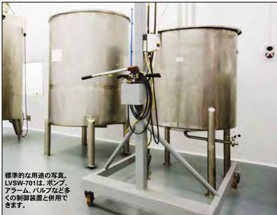
標準的な用途の写真。 LVSW-701は、ポンプ、アラーム、バルブなど多くの制御装置と併用できます。