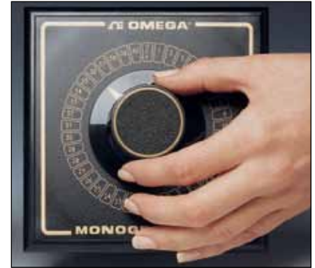
MONOGRAM®シリーズ、 金めっき接点

2極SWおよびOSWシリーズのスイッチは便利な「オフ」ポジションがあります。「オフ」ポジションは開回路にしておいたり、またはスプリアス信号が熱電対装置に記録されるのを防ぐために短絡することができます。各ポールは完全に絶縁されています。迅速で簡単な配線のために、スイッチ後部にある端子は目立つように示されています。