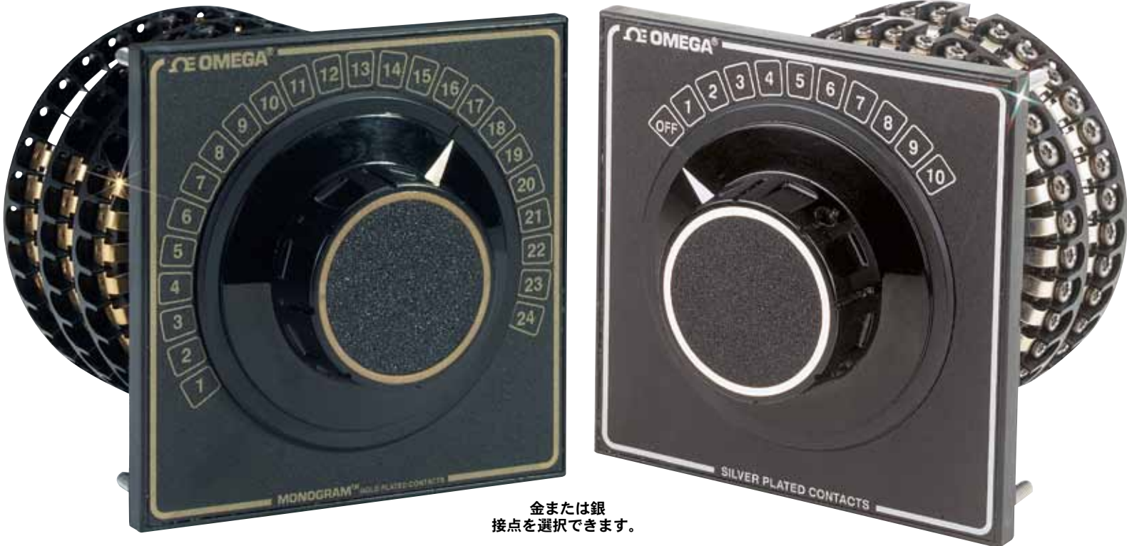
金または銀 接点を選択できます。