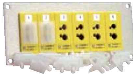
ダストキャップ SPJ-CAP-12 12個の組

熱電対標準サイズパネルジャック(メス)付きです。 色コードはANSIで、Kタイプ熱電対用は黄色です。IEC色コードも可能です。