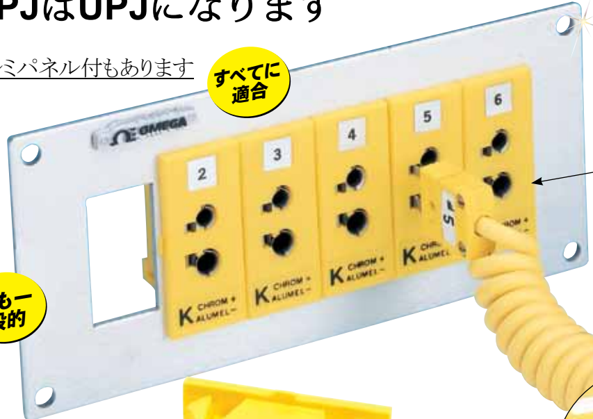
ミニチュアコネクター