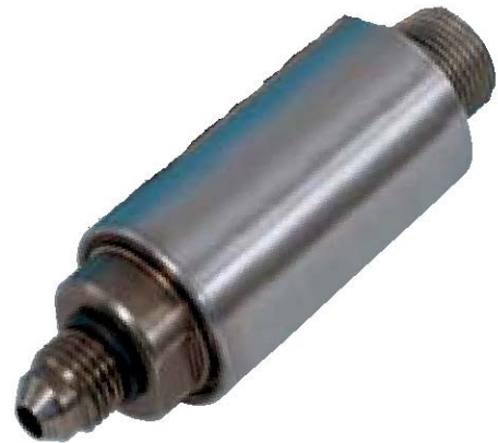
寸法図:単位 mm(インチ) 公称値

販売: 株式会社 パシフィック テクノロジー 〒273-0005 千葉県船橋市本町 6-16-5 アサヒ船橋ビル 602 TEL:047(426)1650 FAX:047(426)1652 E-mail: sales@pac-tech.com URL: http://www.pac-tech.com