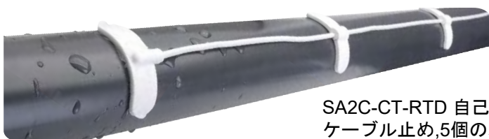
SA2C-CT-RTD 自己接着 ケーブル止め,5個のパック

オプション: より長いケーブルについては、型番の「-120」を必要な長さに変更します。フィートあたりの追加費用がかかります。クラス「A」素子については、型番の「-B」を「-A」に変更します。これには追加費用がかかります。ミニチュアコネクタの場合は、「-MTP」を型番に加えます。追加費用がかかります。TA3Fオーディオコネクタについては、「-TA3F」を型番に加えます。追加費用がかかります。