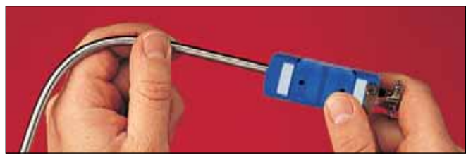
最大許容差のOMEGA CLAD®ワイヤーから製造されています。プローブは外径の2~3倍まで曲げられます。

OMEGA®クイック脱着成形熱電対アセンブリは、1.5、3、4.5、および6 mm (1/16、1/8、3/16、および1/4")のシース外径、標準の300、450、および600 mm (12、18、および24") 公称長さで選択可能です。カスタム長さでも選択可能です。