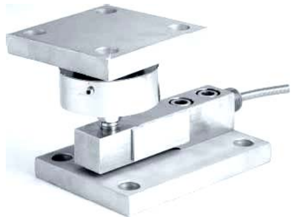
LC501 付きのウェイト モジュール